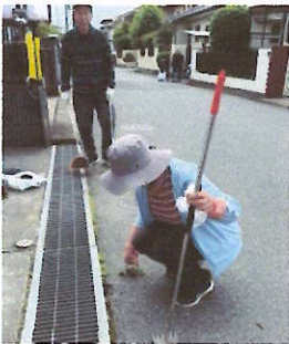
各回収場所の様子

地金堀沿いや自宅近辺の清掃や除草作業のほか、側溝のふたを開けて土砂や落ち葉を取り除く作業にも、多くの方が協力してくださいました。また、お子さんと一緒に参加されるご家族の姿も見られ、地域のつながりを感じる一日となりました。六丁目の皆様のご協力により、町内もきれいになりました。ご参加いただいた皆様、ありがとうございました。また、全ての回収場所でルールを守ってゴミを出していただき、皆様のご協力に感謝申し上げます。