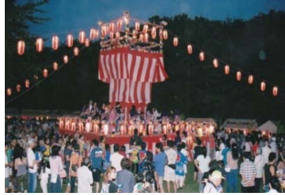
松葉町ふるさと祭り