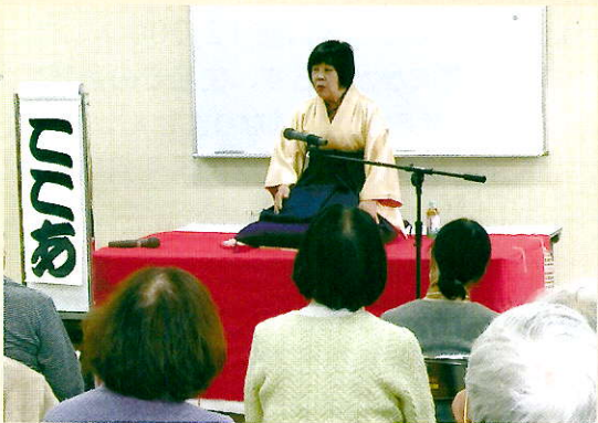
ここあ師匠 「宗論」「猿後家」