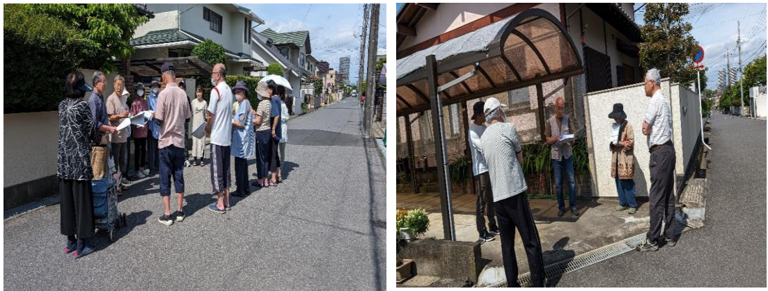
◆小グループミーティングの様子