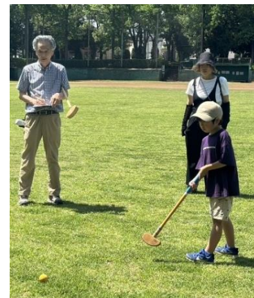
最年少も堂々のショット！