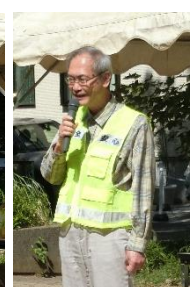
ふるさと協議会 秋元会長