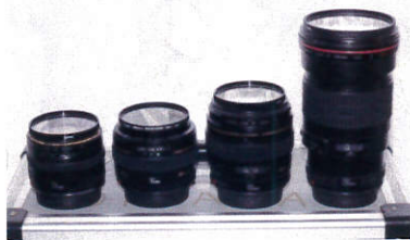
f = 24mm f = 50 mm f = 100 mm f = 200 mm