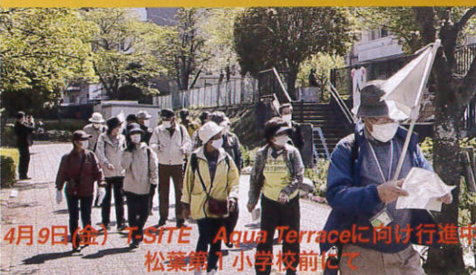
4月9日(金) F SITE Agua Terracel 向け行進隊 松葉第一小学校前にて